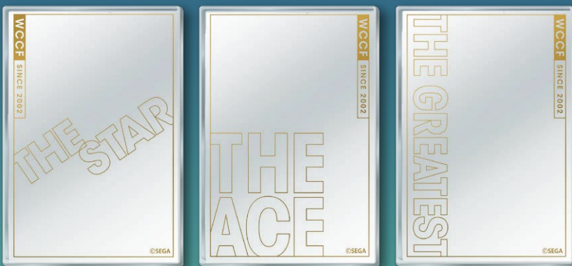
WCCF オリジナル サイドローダー ランダムで1枚もらえます

※デザインはお選び頂けません。3種のうち、1種のサイドローダーが入っています。 ※最大で高さ約 88mm× 幅約 61mm のカードが収納できます。